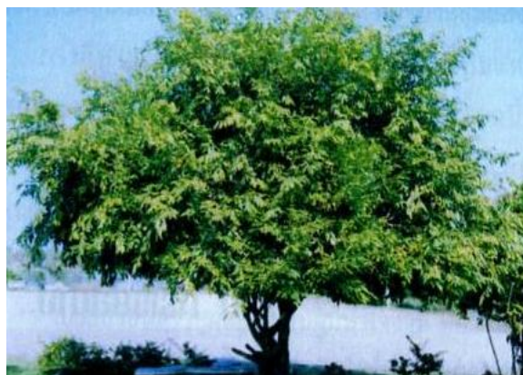
ต้นชุมแสง

๒. เป็นชื่อเรียกตามประวัติศาสตร์ : สมัยพระเจ้าตากสินนำกองทัพออกทำการปราบก๊กต่างๆ ได้ทั้งค่าย และเป็นที่พักแรมอาวุธยุทโธปกรณ์หรือคลังแสง สำหรับปราบก๊กเจ้าเมืองพิษณุโลก ชาวบ้านจึงเรียก บริเวณที่ตั้งค่ายแห่งนั้นว่า “คลังแสง” และต่อๆ มาได้เรียกเพี้ยนเป็น “ชุมแสง”