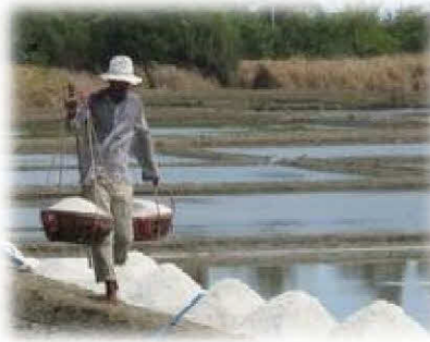
แหล่งทำกินนาเกลือ