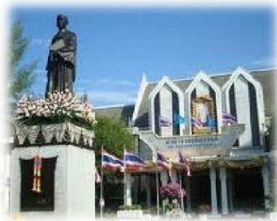
ถิ่นศึกษาสงขลานครินทร์