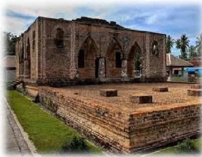
มัสยิดโบราณ