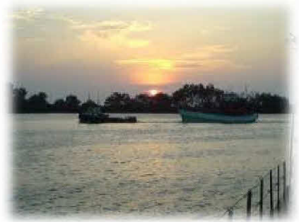
ท่าเรือเศรษฐกิจ