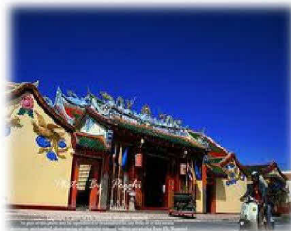
ศาลเจ้าแม่ลิ้มกอเหนี่ยว