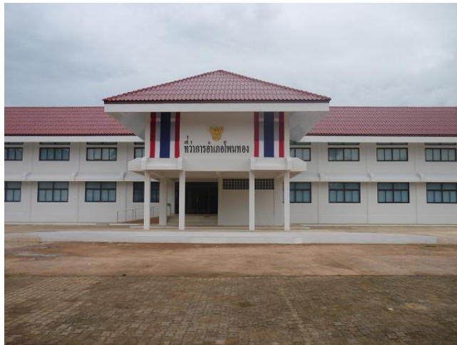
ที่ว่าการอำเภอโพนทอง หลังที่ ๓

อำเภอโพนทองมีข้อมูลการก่อสร้างอาคารที่ว่าการมาแล้ว ๓ หลัง ซึ่งหลังที่ทำพิธีเปิดป้ายในวันที่ ๑๗ พฤศจิกายน ๒๕๕๓ เป็นอาคารที่ว่าการอำเภอโพนทอง หลังที่ ๓ ที่ได้รับการจัดสรรงบประมาณประจำปี พ.ศ. ๒๕๕๒ จากกรมการปกครอง โดยใช้งบประมาณในการก่อสร้างอาคารทั้งสิ้น จำนวน ๑๒,๘๗๒,๐๐๐ บาท (สิบสอง ล้านแปดแสนเจ็ดหมื่นสองพันบาท)