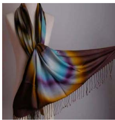
ผ้าบาติก