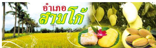
ตลาดรวมผลไม้ ทำนาได้ตลอดปี