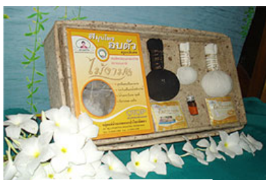
ลูกประคบสมุนไพร

อำเภอป่าโมก มีกลุ่มผู้ผลิตและผู้ประกอบการที่ผลิตสินค้า OTOP ประจำอำเภอ ที่สำคัญ ได้แก่ ตู๊กตาชาววัง กลองนานาชาติ รูปหอม ลวดตัด ศาลพระภูมิไม้สักทรงไทย บ้านทรงไทยจำลอง กระเป๋องเคลือบดินเผา ข้าวกลิ้งโรสเบอร์รี่ จิตรกรรมไทยบาติก น้ำพริก ขนมหวานไทยโบราณ ที่ขึ้นทะเบียนและผ่านการคัดสรรจำนวน ๒๐ กลุ่ม ๓๖ ผลิตภัณฑ์ อาทิ กลองนานาชาติ ตู๊กตาชาววัง ศาลพระภูมิไม้สัก รูปหอม ลูกประคบสมุนไพร ฯลฯ