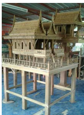
ศาลพระภูมิไม้สักทรงไทย