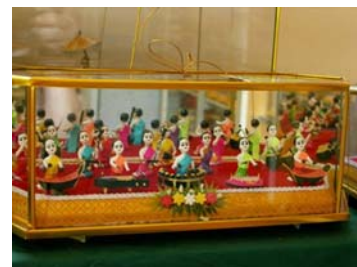
ตู๊กตาชาววัง