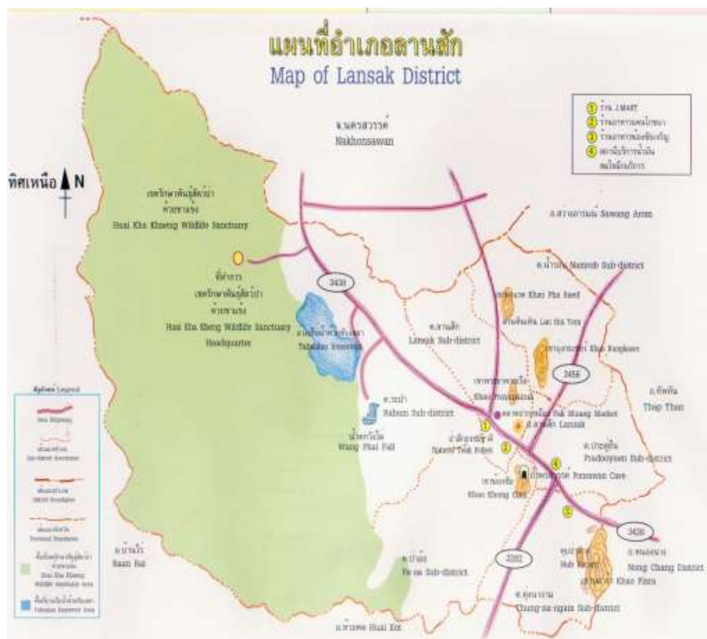
แผนที่อำเภอแล้งสัก